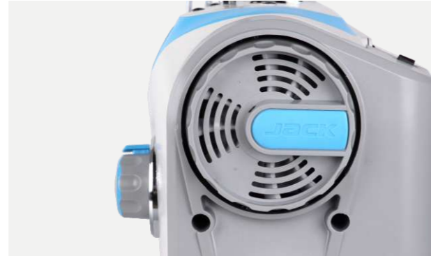
Torque leve y el ventilador disminuye la temperatura