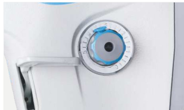
Selector de puntada