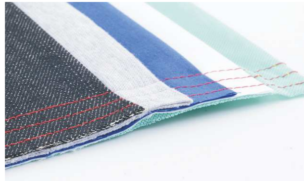
Para materiales livianos y pesados